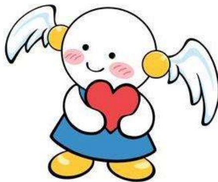
茨城県人権啓発キャラクター 「ココロちゃん」